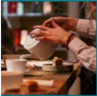
RESTAU LAB : RESTAURANT ÉPHÉMÈRE