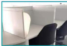
SENSO LAB : LABORATOIRE D'ANALYSE SENSORIELLE (21 cabines)