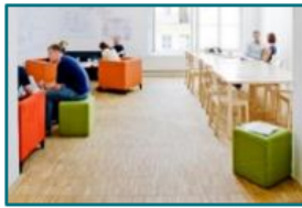
CONSO LAB : ESPACE D'IDEATION et FOCUS GROUPS