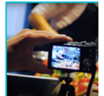
CUISINE DOMES ENREGISTREMENT AUDIO-VIDEO