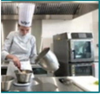
COOK LAB : RE DE CREATION CULINAIRE