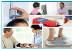
LABORATOIRE DE NUTRITION PRÉLÈVEMENTS ET ENTRETIENS DIÉTÉTIQUES