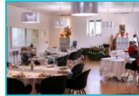
LIVING LAB - RESTAURANT EXPERIMENTAL: ENREGISTREMENT AUDIO-VIDEO