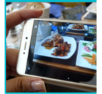
DIGITAL LAB - FLOW FOOD OBSERVATORY WORK