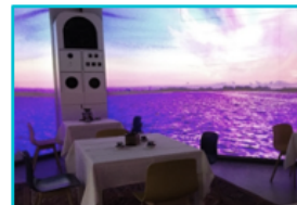
MIXH : SALLE MULTISENSORIELLE